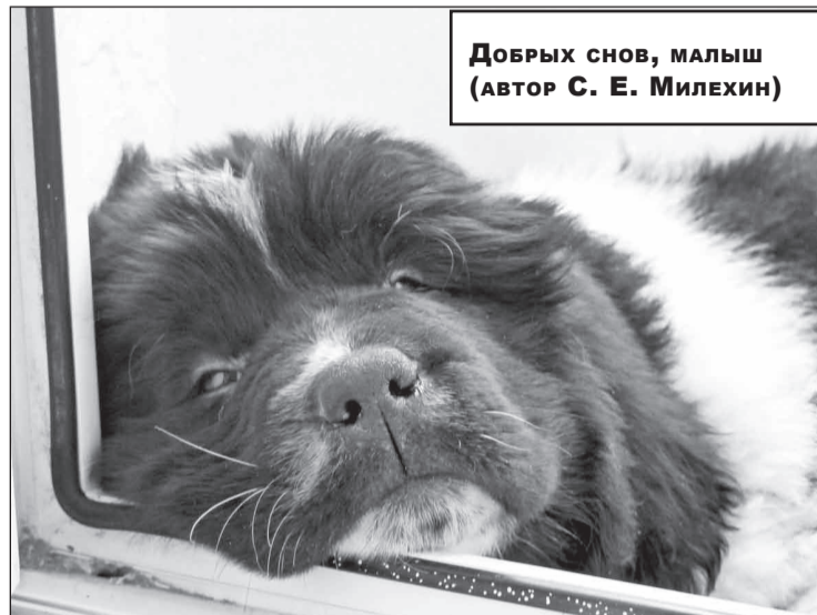
Добрых снов, малыш (автор С. Е. Милехин)

С августа по октябрь в компании проходил корпоративный конкурс фотографий «Хобби дарит мне здоровье». Во время Недели Здоровья были подведены его итоги и награждены победители.